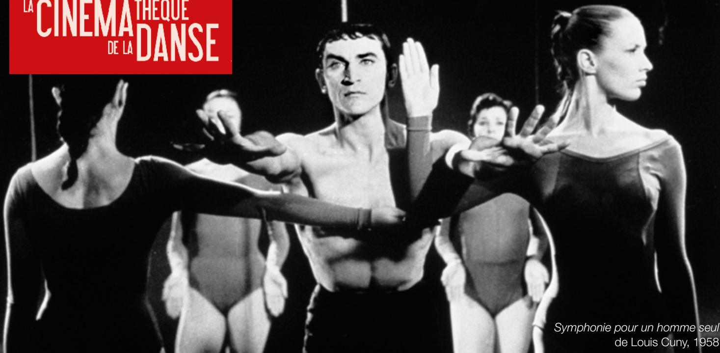
Symphonie pour un homme seul de Louis Cuny, 1958

LA CINÉMATHEQUE FRANÇAISE 51, rue de Bercy 75012 Paris